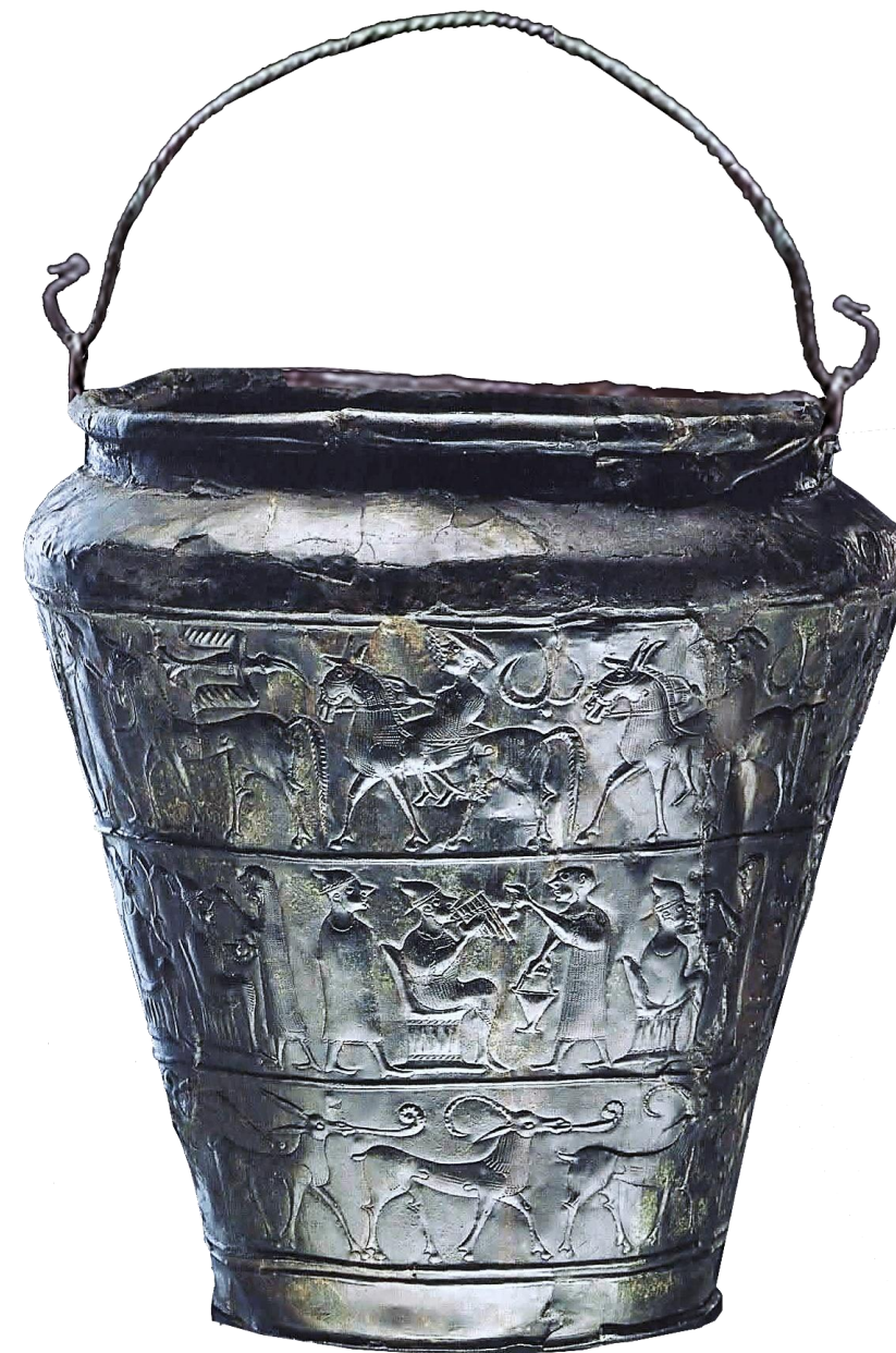
Vrč / situla Vače, 5.st.p.n.št., Narodni muzej Slovenije (NMS).