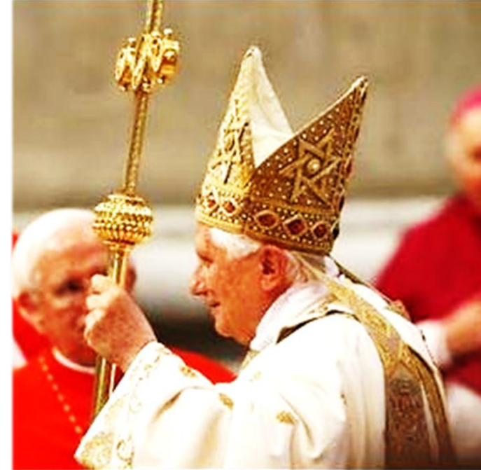
Papež, Janez Pavel II. Kapa MITRA z ribjimi usti.