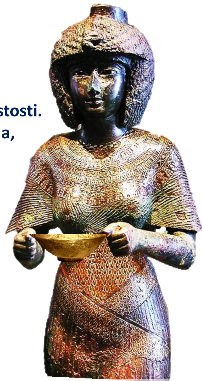
Karomama, Meryetmut, 18. dinastija, muzej Luvr, Francija, mikenska skodelica je računalniško dodana