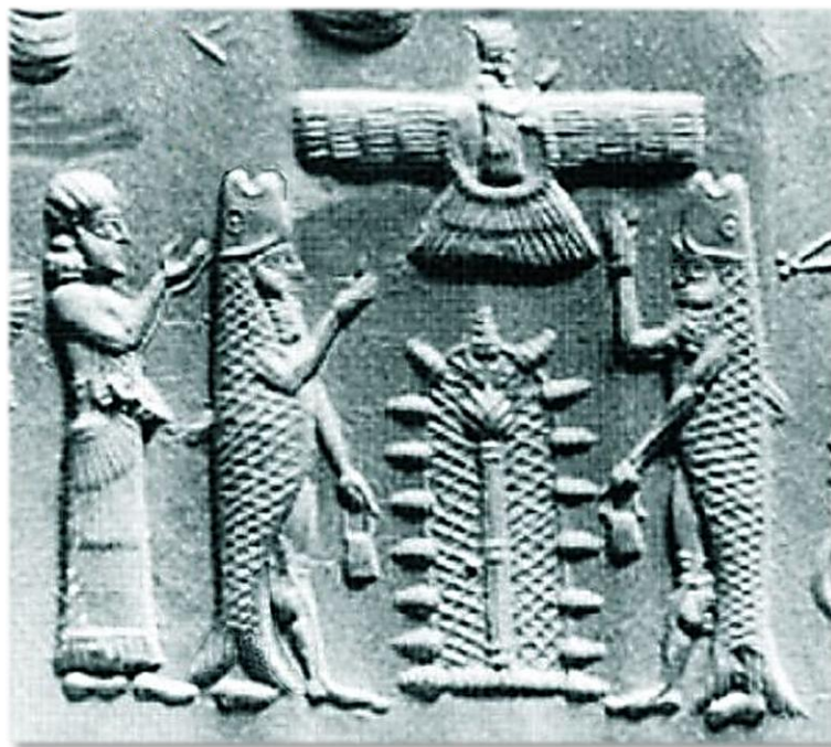
Babilonsko, Marduk in Apkalu „RIBI“, cca 1.600 p.n.št.