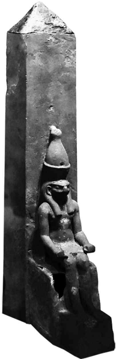
Horus z Obeliskom, Field Museum Chicago