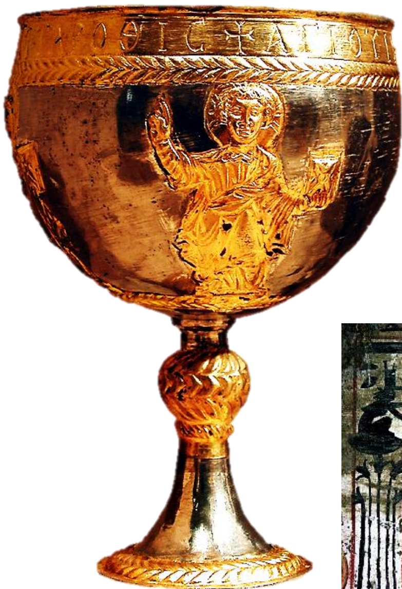
Kelih Janez Krstnik, Jezus, devica Marija, Sirija, 500 – 650 n.št., muzej umetnosti Metropolitan, ZDA