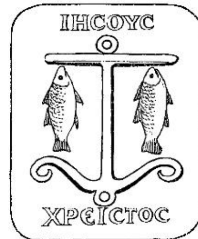
Ribi in sidro, simbol želje Krščanov: „da C postane O“