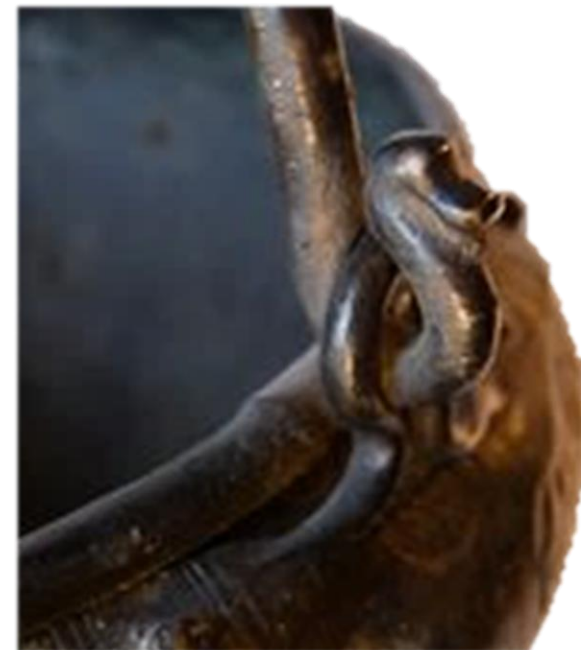
Situla / VRČ Arnoaldi