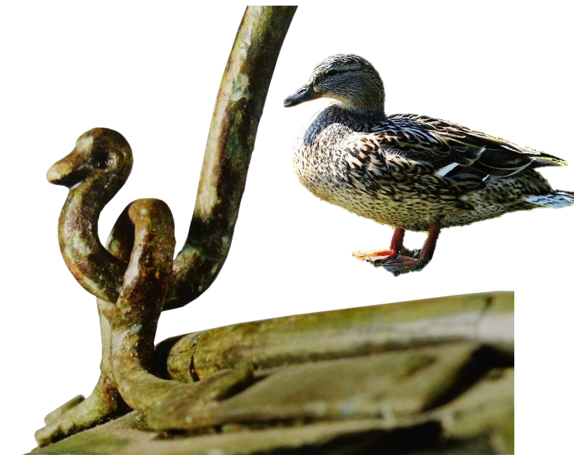
Zaključek ročaja situle, oblikovan kot račja glava (5.–4. st. pr. n. št.). Novo mesto – Kapiteljska njiva, grob III/12.

Napis na platišču VRČA Providence, 530 – 525 p.n.št., višina 26.6 cm, muzej Rhode Island; Vir: 1. , 2. , 3.