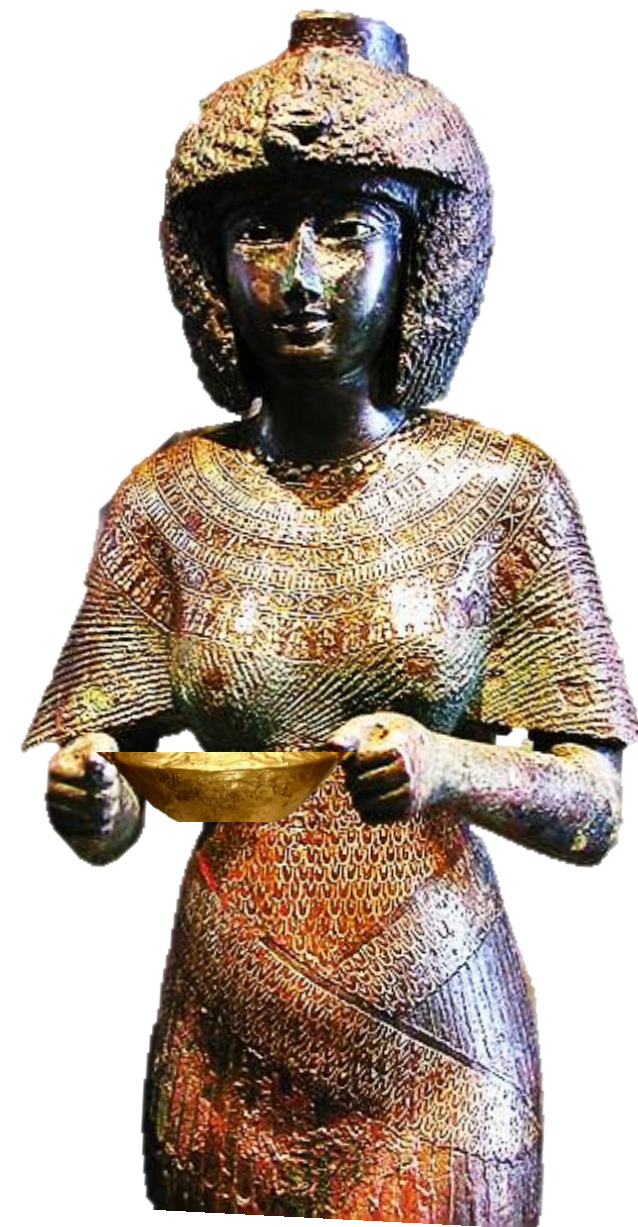
Karomama, Meryetmut, 18. dinastija, muzej Luvr.