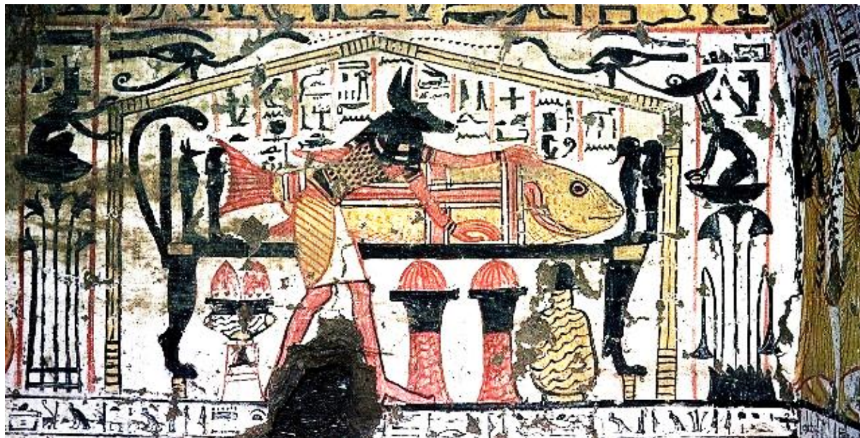
Der el Medina, Anubis pripravljaja faraona za potovanje „RIBE“